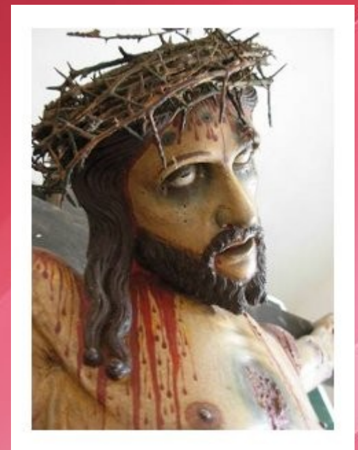
Crocifisso ligneo di frate Angelo da Pietrafitta (sec. XVII) Basilica di Santa Caterina d'Alessandria - Galatina (Lecce)